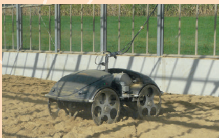
Ein Wenderoboter durchpflügt den Lehm in der solaren Lehm-trocknung.